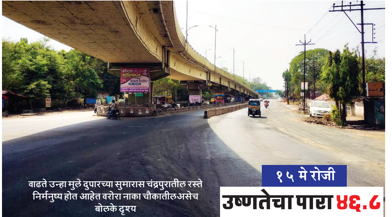
वाढते उन्हा मुले दुपारच्या सुमारास चंद्रपुरातील रस्ते निर्मनुष्य होत आहेत वरोरा नाका चौकातील असेच बोलके दृश्य