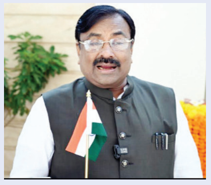
चंद्रपूर / प्रतिनिधी भारतीय स्वातंत्र्याच्या अमृत महोत्सवाची सांगता होत असून आपण आता शताब्दी

■ तिरंगा ध्वज हा केवळ चौकोनी कापडाचा तुकडा नसून भारतीय अस्मितेचे प्रतीक आहे. लाखो शहिदांनी प्राणांची आहुती दिल्यानंतर भारताला स्वातंत्र्य मिळाले आणि त्यानंतर हा तिरंगा ध्वज हाती आला. या अभियानाच्या माध्यमातून सर्व शहिदांचे स्मरण करण्याची संधी देशवासीयांना मिळणार आहे. स्वातंत्र्यसैनिकांनी हस्त हस्त देशासाठी आपले प्राण अर्पण केले. स्वतःच्या परिवारापेक्षा माझा देश म्हणजेच माझा परिवार या भावनेने त्यांनी आपले आयुष्य भारत मातेच्या चरणी अर्पण केले. अश्या वीर शहिदांचे स्मरण करूया. २०४७ साली जेव्हा स्वातंत्र्यदिनी तिरंगाचे ध्वजारोहण केले जाईल तेव्हा या राष्ट्रध्वजाला जगाच्या कानाकोपऱ्यातून लोक वंदन करतील. त्यासाठी प्रत्येक दिवशी देशाला पुढे प्रगतीच्या दिशेने नेण्याचा प्रयत्न करूया असेही ना.मुनगंटीवार म्हणाले.