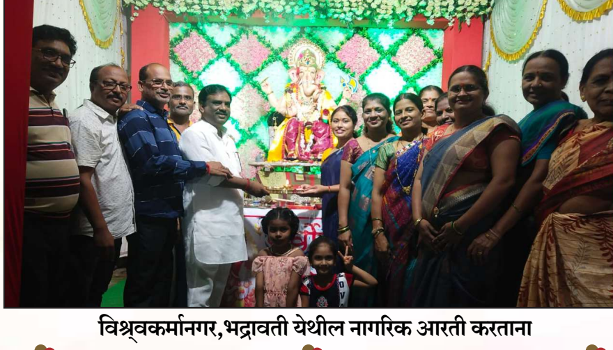
विश्र्वकर्मानगर, भद्रावती येथील नागरिक आरती करताना