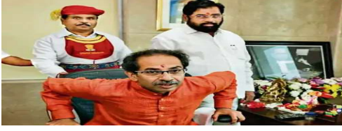
शिवसेना आमदार अपात्रता प्रकरणासंदर्भातील सुनावणी पुन्हा एकदा लांबणीवर गेल्याची माहिती आहे.

मुंबई-राज्यातील सत्ता संघर्षानंतर शिवसेनेच्या आमदार अपात्र प्रकरणावरून सध्या चांगलीच चर्चा रंगली आहे. मात्र, या प्रकरणाची सुनावणी सध्या सर्वोच्च न्यायालयात सुरु आहे. असे असले तरी उद्धव ठाकरे गटाला या प्रकरणात सध्या फक्त 'तारीख पे तारीख' मिळत आहे. त्यामुळे हे प्रकरण आणखी किती दिवस चालेल हे पाहावे लागेल. आता या प्रकरणाची सुनावणी ३ नोव्हेंबर रोजी पार पडणार आहे.