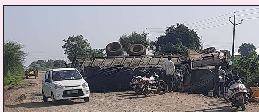
सांगा हो साहेब अजून किती वर्ष लागतील रस्ता बनयला...चिमूर रोड परसोडा पाटी जवळ ट्रक पलटी झाला. असे छोटे मोठे अपघात आता नेहमीचेच झाले आहे.