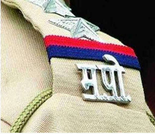
५ हजार ४९५ मुलींचा शोध घेण्यात आला आहे. मुली व महिला हरविल्याच्या तुलनेत त्यांचा शोध घेऊन घरी

राज्यातील विविध पोलीस स्टेशनमध्ये मुली व महिला हरवलेल्याच्या नोंदी घेण्यात येतात. मात्र पोलीस प्रशासनाने केलेल्या तपासाअंती जानेवारी ते ऑगस्ट २०२३ दरम्यान हरवलेल्या २९ हजार ८०७ महिलांपैकी १९ हजार ८९ महिला घरी परतल्या आहेत. त्याचप्रमाणे जानेवारी ते ऑगस्ट २०२३ दरम्यान अपहरण झालेल्या