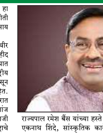
राज्यपाल रमेश बैस यांच्या हस्ते व मुख्यमंत्री ना. एकनाथ शिंदे, सांस्कृतिक कार्ये मंत्री ना सुधीर

७ नोव्हेंबर रोजी सकाळी १०.३० वाजता हा अनावरण समारंभ संपन्न होणार आहे. अशी माहिती राज्याचे वने, सांस्कृतिक कार्ये व मत्स्यव्यवसाय मंत्री ना. सुधीर मुनगंटीवार यांनी दिली आहे. कुपवाडा येथे होत असलेल्या या कार्यक्रमात वीर पत्नींना सन्मानित करण्यात येणार असून वीर शहीद कर्नल संतोष महाडिक यांना अभिवादन करण्यात येईल. विशेष म्हणजे या कार्यक्रमासाठी राष्ट्रीय रायफल्स-४१ चे जवान अतिशय उत्साहित असून हा कार्यक्रम यशस्वी करण्यासाठी झटत आहेत. मागील आठवड्यात हा पुतळा जेव्हा या परिसरात दखल झाला तेव्हा जवानांनी ढोल ताशे आणि झांज वाजवून जल्लोषात स्वागत केले. छत्रपती शिवाजी महाराजांच्या या अश्वारूढ पुतळ्याचे पूजन महाराष्ट्राचे