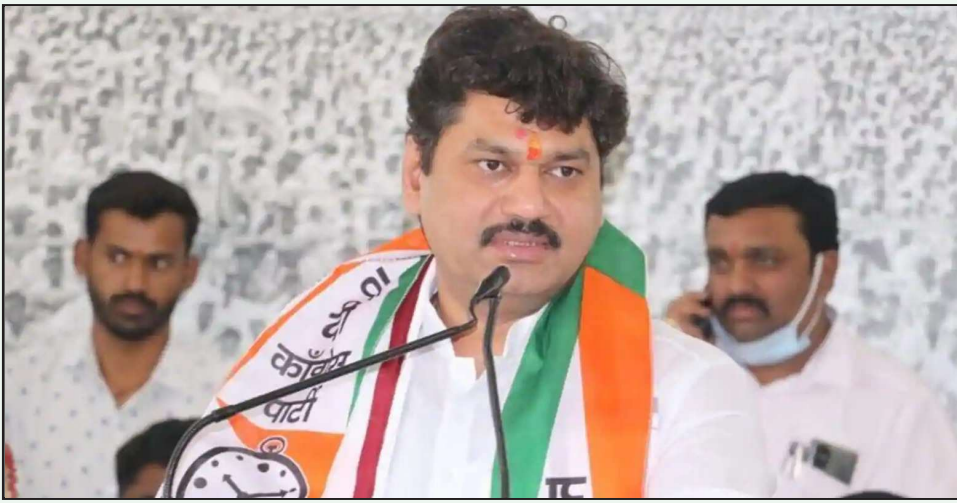
अंतरिम नुकसानीचे अहवाल प्राप्त झाले आहेत. त्या अहवालानुसार संबंधित जिल्हा प्रशासनाने निर्गमित केलेल्या अधिसूचनांना अनुसरून राज्यातील ३५ लाख ८ हजार शेतकऱ्यांच्या खात्यावर एकूण १ हजार ७४३ कोटी रुपये एवढी पीक विम्याची रक्कम वितरीत करण्यास आजपासून सुरुवात झाली आहे.

मुंबई। प्रतिनिधी राज्यातील वेगवेगळ्या जिल्ह्यांत हवामानातील असमतोलामुळे खरीप हंगाम वाया गेला आहे. शेतकऱ्यांचे मोठ्या प्रमाणात नुकसान झाले आहे. नुकसानग्रस्त शेतकऱ्यांना मदत मिळावी, यासाठी विरोधी पक्षाकडून सातत्याने सरकारवर टीका केली जात होती. आता दिवाळी सणाच्या तोंडावर राज्य सरकारकडून मोठी घोषणा करण्यात आली आहे. राज्यातील नुकसानग्रस्त शेतकऱ्यांना पीक विम्याचे वाटप करण्यास सुरुवात झाल्याची महत्त्वाची माहिती राज्यचे कृषीमंत्री धनंजय मुंडे यांनी दिली आहे. ते मुंबईत प्रसारमाध्यमांशी बोलत होते. राज्यातील विविध जिल्ह्यांतील नुकसानग्रस्त क्षेत्रांचे केलेल्या सर्वेक्षणाचे अंतरिम नुकसानीचे अहवाल प्राप्त झाले आहेत. त्यानुसार राज्यातील ३५ लाख शेतकऱ्यांना विम्याची रक्कम दिली जाणार आहे. ही रक्कम शेतकऱ्यांच्या बँक खात्यात जमा केली जाणार आहे. आजपासून विम्याची रक्कम वितरीत करायला सुरुवात झाली आहे, अशी माहिती कृषीमंत्र्यांनी दिली. प्रसारमाध्यमांशी संवाद साधताना कृषीमंत्री धनंजय मुंडे म्हणाले की, नुकसानग्रस्त क्षेत्रांचे केलेल्या सर्वेक्षणात