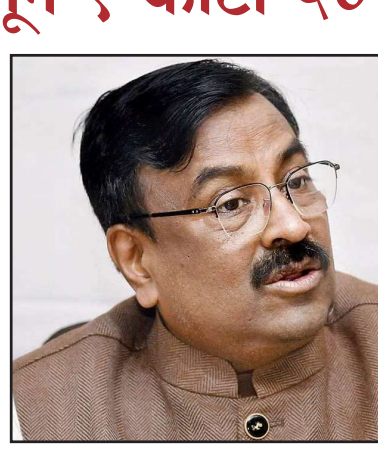
विकास कामासाठी ३० लक्ष रुपयांपर्यंत अर्थसंकल्पीय तरतूद करण्याचे अधिकार मुख्य कार्यकारी अधिकारी यांना होते. या

चंद्रपूर । प्रतिनिधी राज्याचे वने, सांस्कृतिक कार्य मंत्री तथा जिल्हाचे पालकमंत्री सुधीर मुनगंटीवार यांच्या विशेष प्रयत्नातून पांढरकवडा (ता. चंद्रपूर) येथील श्री. पंचमुखी हनुमान मंदिराचा कायापालट होणार आहे. विशेष बाब म्हणून राज्य शासनाने या मंदिराच्या विकाससाठी १ कोटी ५० लक्ष रुपये मंजूर केले आहे. पांढरकवडा (ता. चंद्रपूर) येथील श्री. पंचमुखी हनुमान मंदिर हे 'क' वर्ग दर्जाचे तीर्थक्षेत्र असून या तीर्थक्षेत्राच्या मुलभूत सोयी-सुविधांसाठी १ कोटी ५० लक्ष रुपयांचे अंदाजपत्रक तयार करण्यात आले होते. याबाबतचा प्रस्ताव जिल्हा प्रशासनाने शासनकडे सादर केला. मात्र जिल्हास्तरावरील 'क' वर्ग तीर्थक्षेत्राच्या