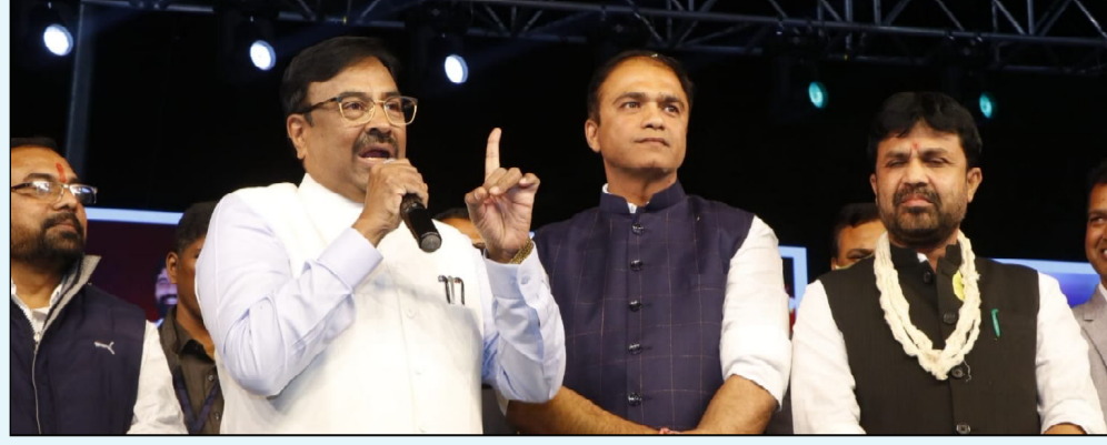
विविध क्रीडा विषयक कामांना प्रशासकीय मंजूरीचा आदेश घेऊन आलो आहे. जिल्हाला आणखी निधी पाहिजे