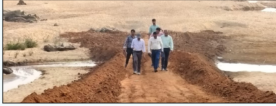
रेतीघाटाच्या तपासणीसाठी भूमिअभिलेख अधीक्षकांना पत्र दिले असल्याचे त्यांनी सांगितले. याशिवाय पोलिसातही रेती चोरीची चौकशी करण्यासंदर्भात तक्रार दिल्याचे सांगितले. पण आतापर्यंत ना मोजमाप झाले, ना अज्ञात रेती चोरट्यांवर गुन्हा दाखल झाला.भामरागडला लागून असलेल्या त्या रेती चोरीच्या ठिकाणावरून रेती काढली जात असताना संबंधित तलाठी किंवा मंडळ अधिकाऱ्याला याची