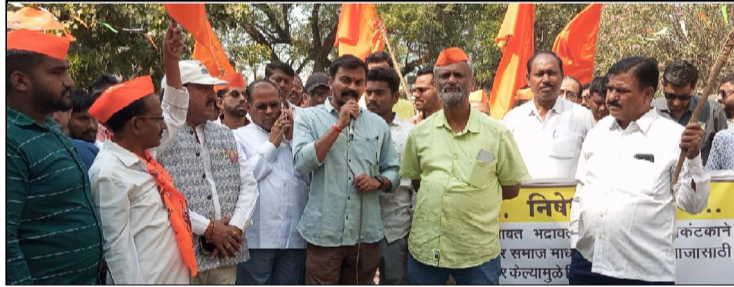
वरोरा । प्रतिनिधी

प्रभु रामचंद्रांच्या बाबत आक्षेपार्य पोस्ट समाज माध्यमावर टाकण्याच्या व्यक्तीच्या निषेधार्थ ३० जानेवारी रोज मंगळवार ला वरोरा शहरात निषेध मोर्चाचे आंदोलन करण्यात आले होते.