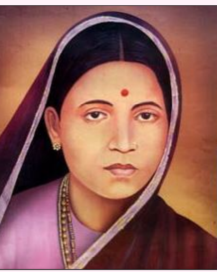
मार्केटमधील मासळी बाजार येथे बुधवार दि.४ एप्रिल १९०६ रोजी त्यांचे भीमरावांसोबत लग्न झाले. त्यांच्या जीवनाच्या अनेक हृदयदायक घटना सांगता येतील. एका प्रसंगी बाबासाहेबांच्या सत्कार समारंभात माईंना नसायला लुगडे नव्हते. तेव्हा त्यांनी बाबासाहेबांचा फेटा लुगडे म्हणून घातला. गरिबीची केवढी मोठी शोकांतिका! पण रमाईंच्या त्यागामुळे आज देशातील लाखो महिलांचे जीवनच बदलून गेले आहे. माई संसारात रमल्या, परंतु भीमराव पुस्तकांत रमले.