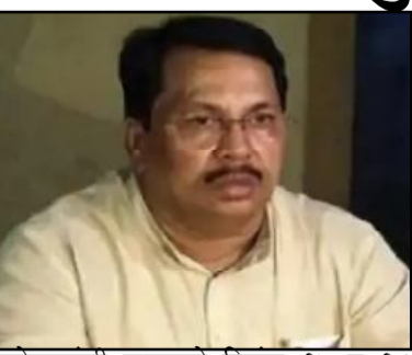
उमेदवारांची कागदपत्रे दिनांक १७ व १८ ऑगस्ट, २०२३ रोजी तपासून पूर्ण झालेली असूनही मागील ७ महिन्यांपासून यांच्या नियुक्तीची प्रक्रिया या कृषी विभागाकडून अजूनही पूर्ण झालेली नाही. यामुळे या

मुंबई-महाराष्ट्र लोकसेवा आयोगामार्फत घेण्यात आलेल्या महाराष्ट्र कृषी सेवा परीक्षामधून एकूण २०२ उमेदवारांची शिफारस महाराष्ट्र लोकसेवा आयोग मधून करण्यात आली आहे. या उमेदवारांना मागील ७ महिन्यांपासून नियुक्ती न दिल्याने ते दोन दिवसांपासून आझाद मैदानात बेमुदत आंदोलनाला बसले आहेत, या उमेदवारांना नियुक्तीचे आदेश तात्काळ द्यावेत, अशी मागणी विधानसभेचे विरोधी पक्षनेते विजय वडेद्वीवार यांनी विधानसभेत केली आहे. कृषी उपसंचालक (वर्ग १) १९, तालुका कृषी अधिकारी (वर्ग २)-६१, मंडळ कृषी अधिकारी (वर्ग २)-१२२ अशा एकूण २०२ उमेदवारांची शिफारस महाराष्ट्र लोकसेवा आयोग मधून करण्यात आली आहे. यासर्व