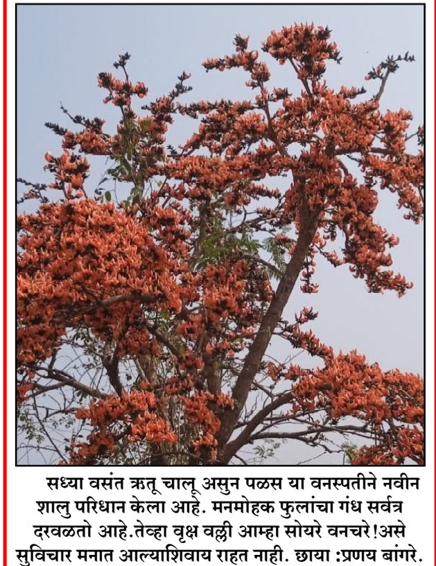
सध्या वसंत ऋतू चालू असून पळस या वनस्पतीने नवीन शालू परिधान केला आहे. मनमोहक फुलांचा गंध सर्वत्र दरवळतो आहे. तेव्हा वृक्ष वृद्धी आम्हा सोपे वनचरे। असे सुविचार मनात आल्याशिवाय राहत नाही.

त्यामुळे आता आधी चर्चा सुरु होती, त्या प्रमाणे पंकजा मुंडे, ग्रामविकास मंत्री गिरीश महाजन आणि वनमंत्री सुधीर मुनगंटीवार हे आगामी लोकसभा निवडणुकीत उमेदवार नसतील, हे जवळपास निश्चित झाले आहे. आजी-माजी मंत्र्यांच्या भाजप लोकसभा निवडणुकीत उतरवणार असल्याची या आधी चर्चा रंगली होती.