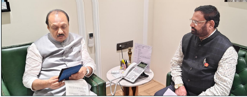
टप्पाटप्पाने १०० टक्के अनुदानावर आलेल्या शाळा व तुकडीवर कार्यरत राज्यभरातील सर्व शिक्षक शिक्षकेतर कर्मचाऱ्यांना नवीन पेंशन योजना लागू करण्यात आली. नोव्हेंबर २००५ पूर्वी नियुक्त होऊनही राज्यातील सर्व