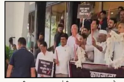
आघाडीच्या आमदारांनी हातात गाजर घेत सरकारचा निषेध केला. दरम्यान, कापसाची माळ घालून आक्रमक होत सरकारविरोधात विधिमंडळाच्या पायऱ्यांवर विरोधकांनी याप्रसंगी शेतकऱ्यांवर अन्याय करणाऱ्या सरकारचा धिक्कार असो, कापूस, सोयाबीन, धान, संत्रा उत्पादक शेतकऱ्यांला फसवणाऱ्या सरकारचा, कांद्याची निर्यातबंदी करणाऱ्या सरकारचा धिक्कार असो अशा

मुंबई-राज्यविधिमंडळाच्या अर्थसंकल्पीय अधिवेशनाच्या तिसऱ्या दिवशीही कामकाज सुरू होण्यापूर्वीच विधिमंडळ परिसरात विरोधकांनी आक्रमक पवित्रा घेतला. 'शासन आपल्या दारी आले, मिळाले गाजर, कांद्याचा कुरूप वांटा, महायुतीने दिले गाजर', 'शेतकऱ्यांनी मागितली मदत, सरकारने दिले गाजर', 'कापसाला पाहिजे होता हमीभाव, मिळाले गाजर, म्हणत सरकारच्या विरोधात विधिमंडळ परिसरात जोरदार निदर्शने केली. राज्यातील जनतेला विकासाचे दिवा स्वप्न दाखवणाऱ्या ट्रिपल ईजिन सरकारने राज्यातील शेतकरी, मजूर, कामगार, विद्यार्थी, महिला, बेरोजगार यांना वेळोवेळी विकासाच्या नावाखाली गाजर दाखवले आहे. म्हणून, विधानसभा आणि विधान परिषदेचे विरोधी पक्षनेते आणि महाविकास