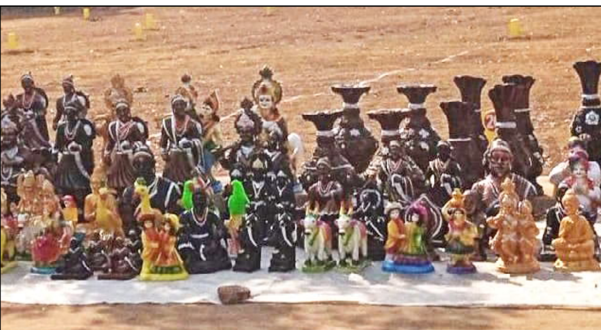
नागभीड येथील शिवकैडी स्त्यावर महाशिवरात्री यात्रेनिमित्त विक्रीसाठी दुकानदाराने मांडलेल्या भगवान क्रिष्ण, शिवमहादेव, छत्रपती शिवाजी महाराज, तसेच इतर आकर्षक विलोभनीय मुर्त्या.