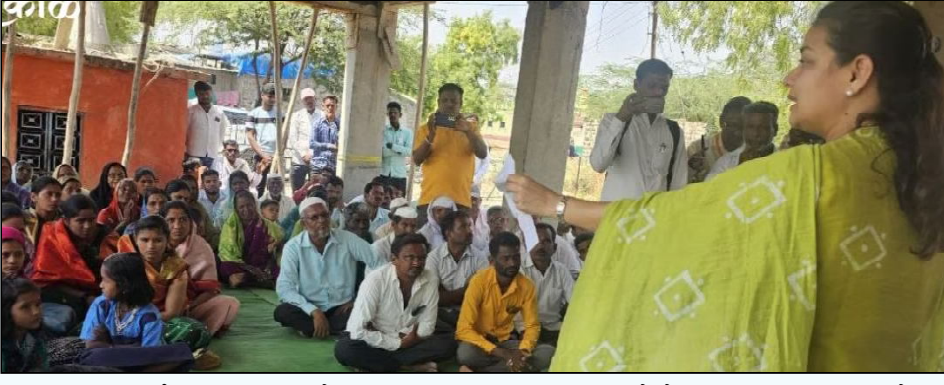
दर पाच वर्षांला नवीन उमेदवार द्यावा लागतोय. दुष्काळी निकषांमध्ये सोलापूर लोकसभा मतदारसंघातील तालुके वाळण्यात आणल्याने मोठा