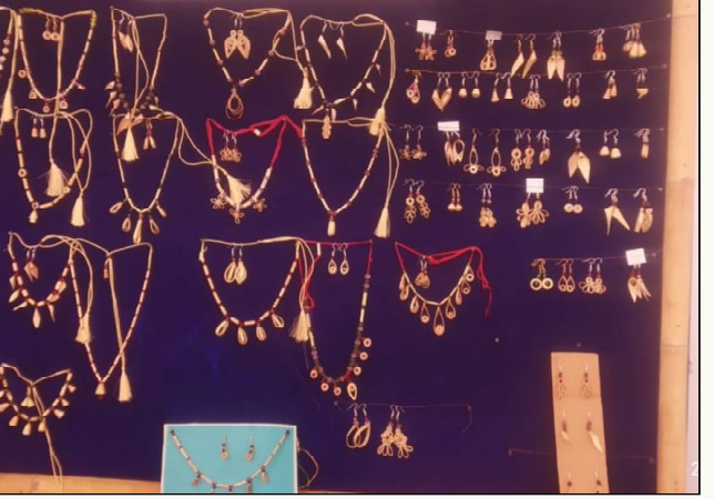
घेता या प्रशिक्षणात महिलांना विविध लाभ आवश्यक साधनसामुग्री सह प्रकारची बांबू ज्वेलरी तयार करण्याचा देण्यात आला. प्रशिक्षणाकरिता संपूर्ण

चंद्रपूर । प्रतिनिधी झपाट्याने विस्तार होत असलेल्या बांबू क्षेत्रात प्रशिक्षणाच्या माध्यमातून महिलांना उपजिवीकेचे साधन प्राप्त व्हावे, या उद्देशाने विचपल्ली येथील बांबू संशोधन आणि प्रशिक्षण केंद्रात (बीआरटीसी) आठ दिवसीय ज्वेलरी प्रशिक्षण घेण्यात आले. यावेळी महिलांनी बांबू पासून ज्वेलरी तयार करून आपल्यातील सुस कलागुणांचे सादरीकरण केले. ज्वेलरी प्रशिक्षण कार्यक्रमाचा समारोप नुकताच करण्यात आला. २० महिलांनी या प्रशिक्षणाचा लाभ घेतला. बाजारपेठेत असलेल्या विविध धातूच्या ज्वेलरी आपल्याला नेहमीच दिसतात, परंतु बांबू वस्तूंची वाढती मागणी लक्षात