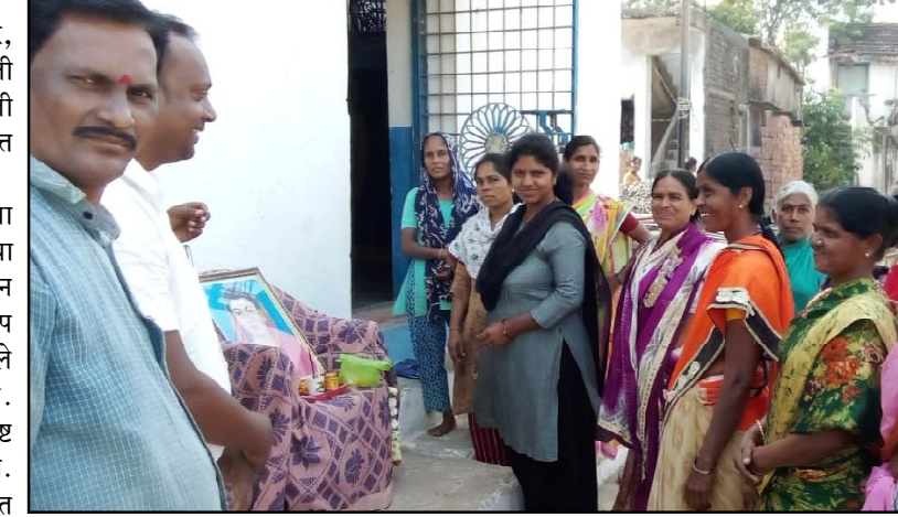
सर्व किमया केवळ सावित्रीबाई फुले मुळेच घडली. महिलांनी सावित्रीबाई फुले यांचे विचार अंगीकृत करून सर्वत्र प्रगती करावी. सावित्रीबाई फुले यांचे विचार व कार्य सर्वांसाठी प्रेरणादायी आहेत. अशा शब्दात मान्यवरांनी क्रांतीज्योती सावित्रीबाई फुले