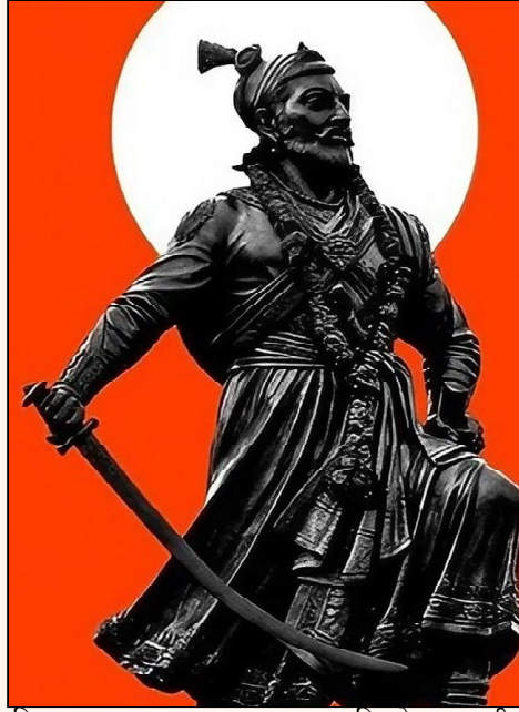
विजय झाला. महाराज युद्धात ७ किलो वजनाची तलवार घेऊन लढायचे. त्यांचे वडील छ.शिवाजी महाराज यांचे सन १६८१ मध्ये निधन झाले. त्यानंतर त्यांनी कधीही मागे वळून पाहिले नाही आणि सर्वात

संभाजी महाराजांनी वयाच्या १६व्या वर्षी आयुष्यातील पहिले युद्ध लढले. त्यात महाराजांचा