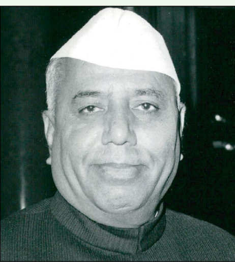
संपादन केला. मुंबई राज्याचे विभाजन होऊन महाराष्ट्र राज्याची स्थापना झाल्याने काहीही उलथापालथ होणार नाही, याची खात्री त्यांनी वरिष्ठ नेत्यांना पटवून दिली. यशवंतरावांनी चिनी आक्रमणानंतर संरक्षण खात्यात चैतन्य आणण्याची जबाबदारी पार पाडली. सन १९६७च्या निवडणुकीनंतर काँग्रेसचा अनेक

यशवंतराव बळवंतराव चव्हाण हे महाराष्ट्र राज्याचे पहिले मुख्यमंत्री आणि एक राष्ट्रीय नेते होते. देवराष्ट्रे- सातारा जिल्ह्यातील कराड येथील एका सामान्य शेतकरी कुटुंबात दि.१२ मार्च १९१३ रोजी त्यांचा जन्म झाला. प्राथमिक शिक्षण कराड येथे घेऊन उच्च शिक्षण कोल्हापूर व पुणे येथे घेतले. ते बीए नंतर एल्एबी झाले. इ.स.१९३० साली महात्मा गांधींच्या सविनय कायदेभंग चळवळीत त्यांनी भाग