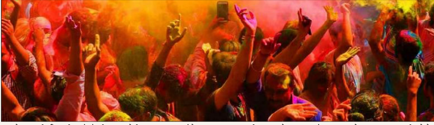
असावेत. काही ठिकाणी वसंतपंचमीला नवात्रेष्टी करतात. शेतातून नवीन पिकांच्या लोंब्या आणून त्या देवतेला अर्पण केल्यानंतरच नवात्र भक्षण करावयाचे असते, असे सांगितले जाते. कारण- आला वसंत ऋतू आला। वसुंधरेला हसवायला।। सजवीत नटवीत लावण्याला। आला, आला वसंत ऋतू आला।। वसंतपंचमीपासून फाल्गुन पौर्णिमेपर्यंत

साजरा होत असावा. परंतु नंतर हिंदुधर्म शास्त्रकारांनी तसेच पुराणकारांनी वसंतपंचमीच्या उत्सवाशी काही धार्मिक कथा जोडलेल्या आढळतात. मात्र कविमन गाते- हा वसंत रंग भरीत जगती येतसे पहा, बहरल्या दिशा दहा!! कोकिळा ही उपवनात, अमृत मधुर गीत गात!! रम्य दिवस चांद्रात, फिरत फिरत भृंग हा!! वसंतपंचमीच्या दिवशी धार्मिक व्रतविधी फारसे नसतात. या सणाचे लौकिक अंग अधिक ठळकपणे उदून दिसते. वसंत ऋतूत निर्माण होणाऱ्या चैतन्यदायी वातावरणामुळे उल्लासित झालेल्या मनांचा आविष्कार विविध प्रकारच्या मनोरंजक कार्यक्रमांतून व्यक्त होतो. आनंदाचे प्रकटीकरण हाच या सणाचा उद्देश दिसतो. या दिवशी मुलांना कोणाच्याही बागेत जाऊन फळे तोडण्याची मुभा असते. काही ठिकाणी उत्साही मुले होळीसाठी लाकडे, गवत वगैरे गोळा करण्यास वसंतपंचमीपासून सुरुवात करतात. मंजुळ पक्षीरच ऐकतच- नकोत मजला विविध सुरांचे कुत्रिम हे हिंदोळे। कोकिळे ऐकव तव मधुर बोल।। ऋतू वसंतातील कोकिळ कुहकुहू बोले। पांडुरंग आले आले।।