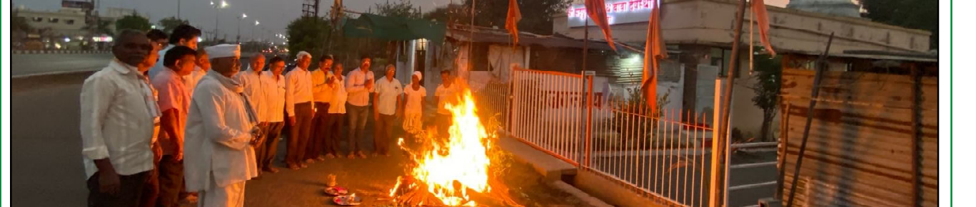
वरोरा येथील आनंदवन चौक स्थित श्री. जगन्नाथ बाबा मठ येथे होलिका दहन करण्यात आले त्यावेळी टिपलेले छायाचित्र :- अनिल वरखडे वरोरा