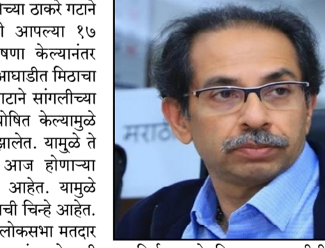
या निर्णयावर फेरविचार करण्याचीही विनंती केली होती. एवढेच नाही तर काँग्रेस नेते विश्वजित कदम यांनी या प्रकरणी थेट काँग्रेस अध्यक्ष मल्लिकार्जुन खरेगे यांची भेट घेऊन आपल्या भावना कळवल्या होत्या. सूत्रांच्या माहितीनुसार, महाविकास आघाडीच्या जागावाटपाच्या चर्चेत सांगली व भिवंडी या २ जागा काँग्रेसला देण्यावर जवळपास मतैक्य झाले होते. पण त्यानंतरही उद्व ठाकरे यांनी

मुंबई (वृत्तसंस्था)-शिवसेनेच्या ठाकरे गटाने लोकसभा निवडणुकीसाठी आपल्या १७ उमेदवारांच्या नावाची घोषणा केल्यानंतर विरोधकांच्या महाविकास आघाडीत मिठाचा खडा पडला आहे. ठाकरे गटाने सांगलीच्या जागेवर परस्पर उमेदवार घोषित केल्यामुळे काँग्रेस प्रदेशाध्यक्ष नाराज झाले. यामुळे ते महाविकास आघाडीच्या आज होणाऱ्या बैठकीला गैरहजर राहणार आहेत. यामुळे मविआतील घुसफूस वाढण्याची चिन्हे आहेत. उद्व ठाकरे गटाने सांगली लोकसभा मतदार संघात कुस्तीपटू चंद्रहार पाटील यांना उमेदवारी दिली आहे. त्यांच्या उमेदवारीवर काँग्रेसने हरकत घेतली आहे. ठाकरे गटाने जागावाटपाची चर्चा सुरू असताना परस्पर सांगलीचा उमेदवार घोषित केल्याचा आरोप काँग्रेस नेत्यांनी केला आहे. काँग्रेस नेते बाळासाहेब थोरात, विजय वडेईवार, संजय निरुपम यांनी या प्रकरणी ठाकरे गटाच्या निर्णयावर आक्षेप घेतला होता. तसेच त्यांना