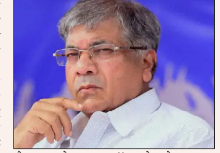
बैठक का घेत आहात?', असे अनेक सवाल आंबेडकर यांनी उपेक्षित केले आहेत. 'सहयोगी असून तुम्ही पाठीवर वार केलेत! सिल्व्हर ओक्स इथल्या मीटिंगमध्ये तुमचे वागणू कसे होते हे आमहाला माहीत आहे. अकोल्यात आमच्या विरोधात उमेदवार उभा करण्याचा मुद्दा सुद्धा तुम्ही उपस्थित केला हे खरे नाही का? तुम्ही कोणत्या प्रकारचे नाते निर्माण करत आहात? एकीकडे तुम्ही आघाडीचा आभास दाखवत आहात तर दुसरीकडे आमहाला पाडण्याचे कारस्थान करत आहात. हे तुमचे विचार आहेत?', असे म्हणत आंबेडकर यांनी संजय राऊत यांच्यावर गंभीर आरोप केले आहेत.

मुंबई (वृत्तसंस्था)-संजय राऊत यांनी आमच्या पाठीत खंजीर खुपसला. आमहाला आघाडीच्या भ्रमात ठेवून लोकसभा निवडणुकीत जागा पाडण्याचे कारस्थान रचले, असा गंभीर आरोप गुरुवारी वंचित बहुजन आघाडीचे नेते प्रकाश आंबेडकर यांनी केला आहे. शरद पवार यांच्या सिल्वर ओक निवासस्थानावर झालेल्या बैठकीत तुम्ही काय भूमिका घेतली होती, तुम्ही आमच्या विरोधात अकोल्यातून उमेदवार उभा करण्याचा मनोदय व्यक्त केला होता की नाही, असा सवालही प्रकाश आंबेडकर यांनी एक ट्विट करून केलाय. संजय राऊत यांनी संविधान रक्षणाची जबाबदारी प्रकाश आंबेडकर यांची असल्याचे सकारळी म्हटले होते. त्यालाच आंबेडकरांनी चोख प्रत्युत्तर दिलेय. महाविकास आघाडीतील जागावाटपावरून सध्या मोठा संघर्ष निर्माण झाला आहे. त्यातच प्रकाश आंबेडकर यांनी ट्विट करत आपला संताप व्यक्त केला आहे. संजय राऊत किती खोट बोलणार? तुमची आणि माझी मते सारखीच असतील तर तुम्ही आमहाला बैठकीला का बोलावत नाही? फोर सीड्स हॉटेलमध्ये ६ मार्चला झालेल्या बैठकीनंतर तुम्ही आमच्या कोणत्याही प्रतिनिधीला का बोलावले नाही? वंचितला आमंत्रण न देता आजही