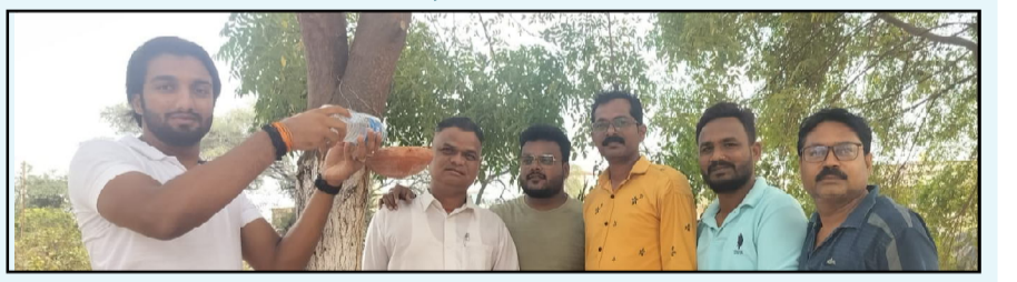
चिंमूर । प्रतिनिधी

आता नेमकेच हिवाळ्याचे दिवस संपत असून उन्हाचा पारा दिवसेंदिवस चढत आहे. त्यामुळे पक्षी पाण्याच्या शोधात असतात. पक्षांना पाणी मिळणे कठीण होत असल्यामुळे पाण्याअभावी हजारो पक्षी मृत्यू मुखी पडत आहेत. या पक्षांना जीवदान देण्यासाठी येथील तरुण पर्यावरणवादी मंडळ पक्ष्यांना पाणी पाजण्याचे अमूल्य कार्य करीत आहे. त्यामुळे त्यांच्या या उपक्रमाचे सर्वत्र कौतुक होत आहे. तरुण पर्यावरणवादी मंडळांनी मागील पंधरा वर्षा पासून गावात व परिसरात पक्षी घागर ही संकल्पना समोर आणली आहे. या नुसार सर्वांत आधी त्यांनी गावात पक्षी घागर चे वाटप केले. तसेच विद्यार्थ्यांना यात आवड निर्माण व्हावी, यासाठी शाळेत ही पक्षी