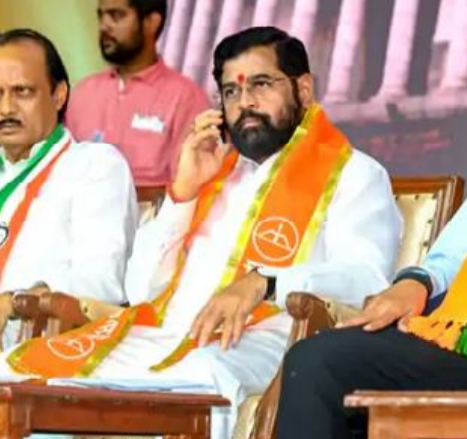
बोलावली असून, यात जागावाटप निश्चित करण्यात येईल. कालच शिवसेनेच्या उद्व गटाने १७ उमेदवार जाहीर केले होते. त्यापैकी ३ जागांवर काँग्रेसचे दावेदार तिकीटाच्या प्रतीक्षेत होते. या घोषणेने शरद पवार संतापले आहेत.

मुंबई (वृत्तसंस्था)-महाराष्ट्रातील भाजप, शिवसेना आणि राष्ट्रवादी काँग्रेस यांच्या महायुतीमध्ये लोकसभा निवडणुकीसाठी जागावाटपाचा फॉर्म्युला जवळपास निश्चित झाला आहे. सूत्रांनी दिलेल्या माहितीनुसार, राज्यातील लोकसभेच्या ४८ जागांपैकी भाजप २७, शिवसेना १४ आणि राष्ट्रवादी ५ जागांवर निवडणूक लढवणार आहे. त्याची अधिकृत घोषणा लवकरच होण्याची शक्यता आहे. यापूर्वी राज्यातील लोकसभेच्या ४८ जागांपैकी भाजप ३० ते ३२ जागांवर, शिवसेना १० ते १२ जागांवर आणि राष्ट्रवादी ६ ते ८ जागांवर उमेदवार उभे करू शकते, अशी अटकळ होती. ६ मार्च रोजी मुंबईतील सह्याद्री अतिथीगृहात अमित शहा यांच्या उपस्थितीत झालेल्या बैठकीत हे एकमत झाले. त्याचेवैधी महाविकास आघाडीने तिन्ही पक्षांची (काँग्रेस, शिवसेना ठाकरे गट, राष्ट्रवादी काँग्रेस शरदचंद्र पवार) ५ वाजता बैठक