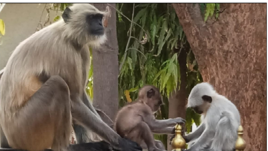
नागभीड वस्थानकसमोर एका घरच्या झाडाखाली इवलेसे छोटे दोन माकड आपसात खेळताना आपल्या मातेसोबत. आपण छोटेसे...बहीण- भाऊ..उदयाला मोठाले होऊ... हे गीत गात तर नसावेत ना?