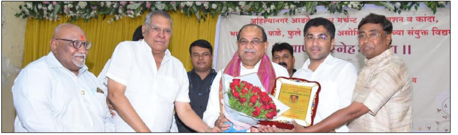
अहमदनगर । प्रतिनिधी

व्यापारी असोसिएशनच्या वतीने संवाद कार्यक्रम संपन्न