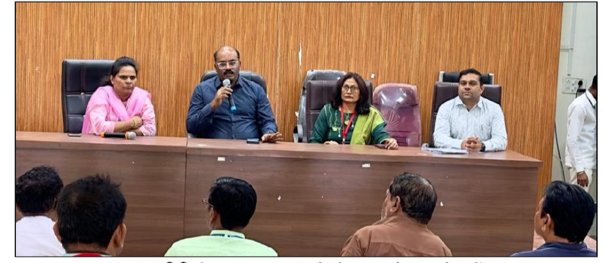
हिंगोली । प्रतिनिधी