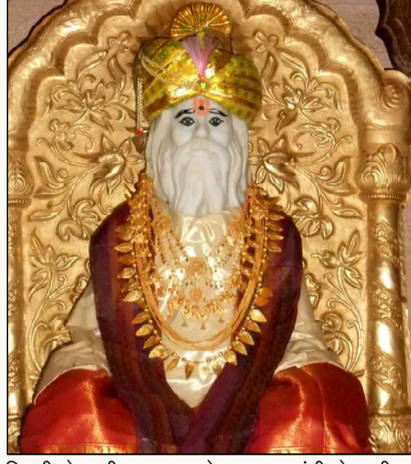
दिवशी गोदावरी स्नान घडावे, म्हणून त्यांनी गोदावरीला आवहन केले. त्यानंतर तेथे गोदावरी आली आणि सोबतच नागेश्वर, त्र्यंबकेश्वर, विश्वेश्वर, सोमेश्वर आणि