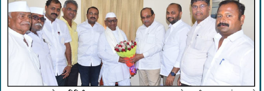
पारनेर । प्रतिनिधी