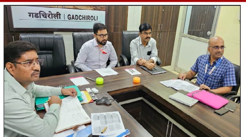
गडचिरोली व अहोरी या तीन विधानसभा मतदारसंघाकरिता मतदान केंद्राध्यक्ष, सहायक केंद्राध्यक्ष, मतदान अधिकारी म्हणून ४ हजार २०१ पुरुष व ६१ महिला मतदान अधिकाऱ्यांची निवड करण्यात आली. यातील सरमिसळ प्रक्रियेतर्गत जिल्हातील आरमोरी, आरमोरी विधासभा मतदार संघात १३३९ पुरुष व १९ महिला, गडचिरोली क्षेत्राकरिता १५७२ पुरुष व २२ महिला तर अहोरी विधानसभा क्षेत्राकरिता १२९० पुरुष व २० महिला मतदान अधिकाऱ्यांची निवड करण्यात आली आहे.