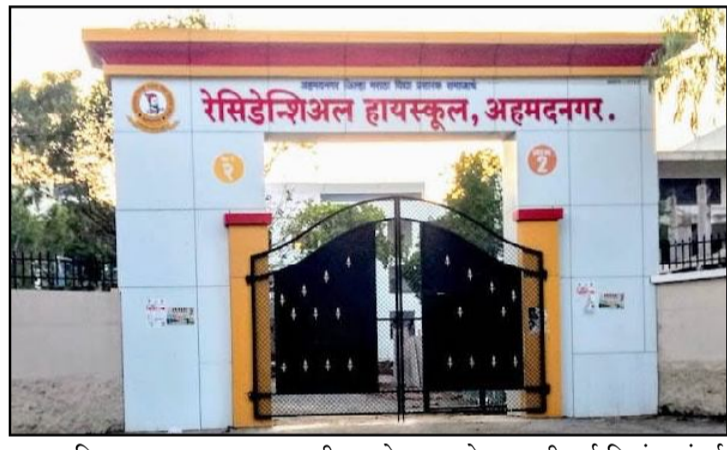
उजाळा मिळणार असून, त्या काळातील अनेक विद्यार्थी व विद्यार्थिनींना संपर्क झाला असून, सर्व या स्नेह मेळाव्यासाठी