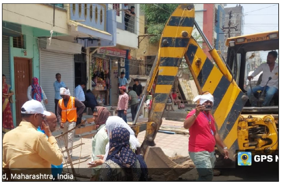
d, Maharashtra, India