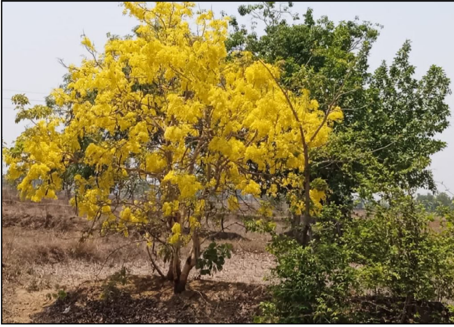
नागभीड तालुक्यातील गोवारपेठ रस्त्यावर पिवळ्या रानफुलांनी सजलेले बाहवा या वनस्पती जातीचे झाड.

विरोधात पुढील पाऊल उचलण्यास प्रशासन आम्हाला जागे करीत असल्याचे दिसून येत आहे. जर का अनधिकृत मंदिराचा मुद्दा पुढे करून जागा हाडपण्याचा प्रकार होत असेल तर ते खपऊन घेतले जाणार नाही असा इशारा देण्यात येईल असे निवेदन कर्त्यांनी बोलून दाखविले आहे.