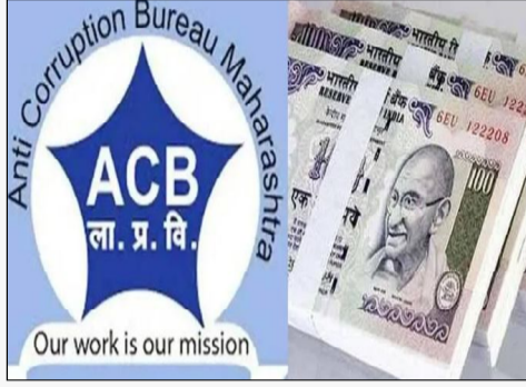
रुपयाची माया जमवली होती. दरम्यान काही दारू दुकाने ही बेकायदेशीरपणे वाटण्यात आले होते. त्यामुळे कित्तेक तक्रारी जिल्हाधिकारी यांच्याकडे देण्यात