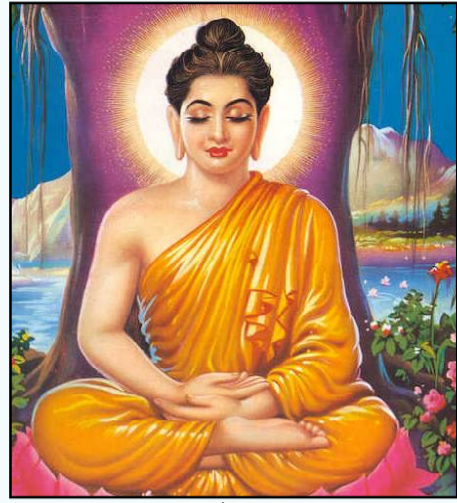
सार्वजनिक सुट्टी जाहीर केली नाही. या सर्व बाबींचा उल्लेख बाबासाहेबांनी सन १९५३च्या आपल्या मुंबईतील बुद्ध जयंती कार्यक्रमाच्या भाषणात स्वतः केला आहे.

साजरी झाली. याप्रसंगी आंबेडकरांनी बुद्धांच्या जीवनकार्यावर विचार मांडले. या जयंती समारोहास अनेक देशांचे वकील, प्रतिनिधी, भिक्खू समुदाय व सुमारे वीस हजार लोकांचा समुदायही उपस्थित होता. अशाप्रकारे भारतात बुद्ध जयंतीची सुरुवात झाली. सन १९५१मध्ये आंबेडकरांच्याच अध्यक्षतेखाली तीन दिवसीय बुद्ध जयंती महोत्सव साजरा झाला. सन १९५६ला बाबासाहेबांनी आपल्या आयुष्यातील शेवटची बुद्ध जयंती दिल्लीतच साजरी केली. दिल्लीनंतर बाबासाहेब आंबेडकरांनी महाराष्ट्रातही बुद्ध जयंतीस सन १९५३पासून सुरुवात केली. सन १९५६पर्यंत त्यांच्या