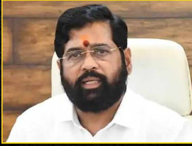
प्रकरणात कुणीही कितीही मोठा आरोपी असला तरी त्याच्यावर कठोर कारवाई करण्याचे निर्देश दिले. या प्रकरणातील आरोपींची सखोल