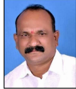
चंदनखेडा या गावात प्रधानमंत्री आवास योजनेचे