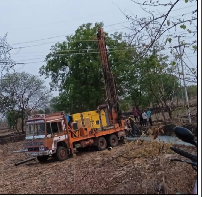
आधुनिक काळात शेतकरी प्रगत झाला. शेतातील आपले उत्पन्न वाढविण्यासाठी वेगवेगळ्या उपाययोजना करू लागला. पाणी वेळेवर आणि मुबलक मिळावा यासाठी नागभीड तालुक्यातील कोर्धा येथील एका शेतात बोर मारतांना शेतकरी.