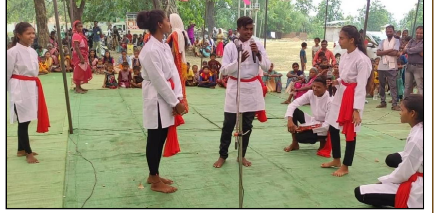
गडचिरोली-भामरागड तालुक्यातील लोकांच्या आधार कार्ड व जन्म दाखला मिळण्यासंबंधीच्या अडचणी सोडवण्याकरिता तसेच महिला आरोग्यावर जनजागृती व्हावी याकरिता पं.स.भामरागड तर्फे आकांक्षीत तालुका कार्यक्रम अंतर्गत 'मिशन पुना आकी' म्हणजेच 'मिशन नवी पालवी' ही मोहीम हाती घेतली आहे.