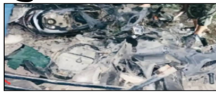
मद्यधुंद चार तरुणांनी कारच्या नंबर प्लेटकाढून टाकत पोबारा केला. याबाबत मिळालेल्या माहितीनुसार शनिवारी (दि.८) रात्री साडे अकरा वाजेच्या सुमारास

छत्रपती संभाजीनगर । प्रतिनिधी पुणे पोर्शे कार अपघाताचे प्रकरण ताजे असताना शहरातील शिवाजीनगर भागात मद्यधुंद तरुणांनी बेफाम कार चालवत धुमाकूळ घातला. भरधाव आणि अनियंत्रित या कारने रस्त्यालगत उभ्या ४ दुचाकींचा अक्षरशः चुराडा झाला. तर एका दुकानासमोर असलेले ६ टेबल व घराच्या ओट्यालाही या कारने धडक देत तोडून टाकले. शनिवारी (दि.८) रात्री साडे अकराच्या सुमारास घडलेल्या या घटनेने शिवाजी नगर परिसरात एकच धबदार पसरली. दरम्यान, कारचालकासह कारमधील