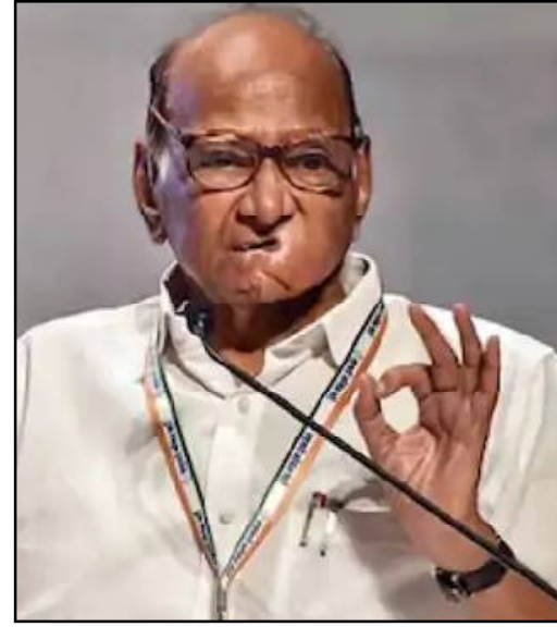
परिस्थिती थोडी वेगळी होती. त्या परिस्थितीही तुम्ही माझ्या अपेक्षेप्रमाणे मतदान केले. शरद पवार म्हणाले की, देशाच्या दृष्टीने महत्त्वाची निवडणूक होती. आम्ही

शरद पवार यांनी गुरुवारी बारामती येथील शिर्सुफळ गावच्या गावकऱ्यांशी संवाद साधला. त्यात त्यांनी उपरोक्त विधान केले. ते म्हणाले की, काही लोकांना वाटते की बारामतीत चमत्कार झाला. परंतु एवढी चर्चा व्हायचे कारण नाही, बारामतीच्या निवडणुकीची चर्चा होण्याचे खरे कारण म्हणजे स्वतः पंतप्रधान नरेंद्र मोदी आहेत. कारण त्यांनी या निवडणुकीत लक्ष घातले होते, निवडणुकीत ज्या गोष्टी मांडायच्या नसतात, बोलायच्या नसतात त्या त्यांनी जाहीरपणे बोलून दाखवल्या. त्यामुळेच या सगळ्या गोष्टींची अधिक चर्चा झाली असे शरद पवार यांनी म्हटले आहे. दरम्यान शरद पवार पुढे बोलताना म्हणाले की, मी आजवर अनेक निवडणुका लढलो आहे. खरंतर मी किती निवडणुका लढलो हे मला आठवतही नाही. सुरुवातीच्या काळात मी मते मागण्यासाठी तुमच्याकडे आलो. मात्र नंतरच्या काळात मी फक्त कामातून तुमच्या संपर्कात राहिलो. मी मते मागण्याला आलो नाही. परंतु, तुम्ही मतदान कधी चुकवले नाही. तुम्ही तुमचे काम चोख करत आला आहात. अजूनही करत आहात. परंतु, या वेळच्या निवडणुकीत