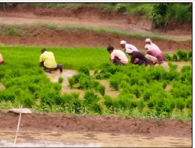
नागभीड तालुक्यातील बागलमंडा येथे रोवणी हंगाम चालू झाला असून एका शेतता पन्हे काढतांना शेतमजूर.