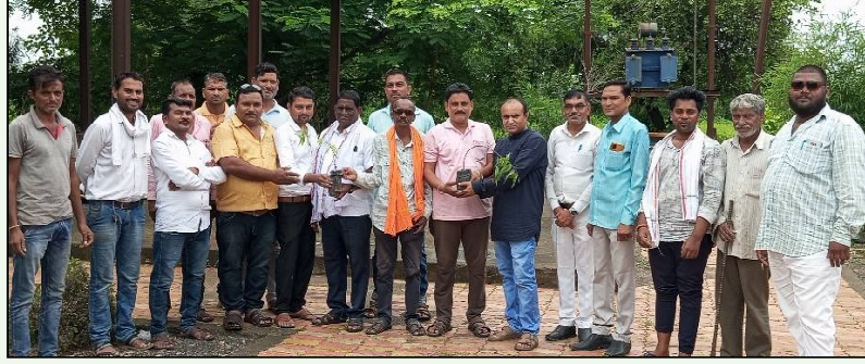
वरोरा । प्रतिनिधी

विद्यार्थ्यांना स्नेहभोजन व वृक्षारोपण ;पुण्याई फाउंडेशन ग्रुप व हरित मित्रपरिवाराचा उपक्रम