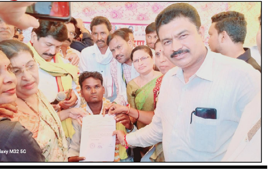
Galaxy M32 5G